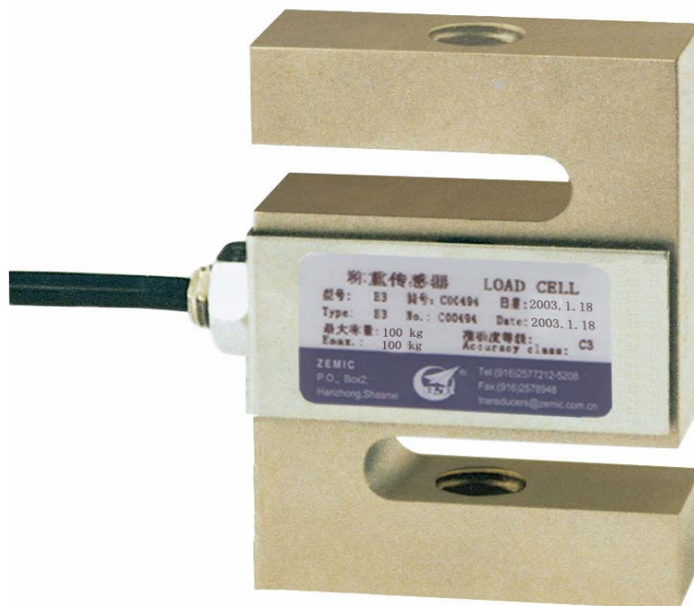
Bild : Wägezelle Typ H3 / 100 kg

The tension load cells of the series H3 are S-type load cells with double bending beam construction in the centre. They are made of alloy steel, the strain gauge application is covered with silicone elastomer. Further essential characteristics are given in the data sheet, see page 5 to 6.